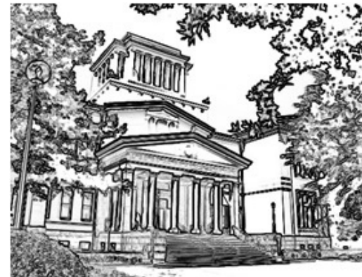
Okurayama Memorial Hall