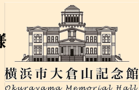
横浜市大倉山記念館 Okurayama Memorial Hall